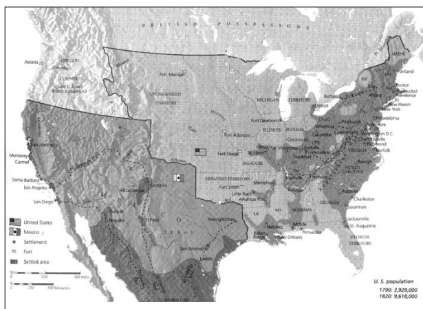
(۱-۴): سال‌های آغازین دهه‌ی ۱۸۲۰ میلادی، حدود مرزها