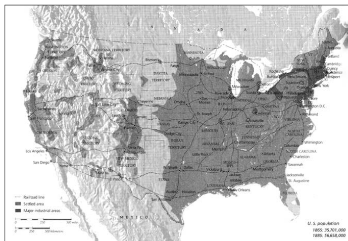
(۱- ۶): ایالات متحده در ۱۸۸۰ میلادی

اقتصاد آمریکا همپای رشد سریع اقتصاد اروپا از اواسط قرن نوزدهم قوت گرفت. پیشرفت های عظیمی به واسطه ی توسعه ی سریع و همه جانبه ی بخش های صنعت، کشاورزی و حمل و نقل ریلی به وقوع پیوست. دولت ها به ندرت با اهرم قوانین و مقررات در رشد خارق العاده ی این دوران دخالت می کردند. سیاست کلی بر مبنای عدم مرحله ی دولت در امور اقتصادی استوار بود. طبقه ی متوسط، بازرگانان و پیشه وران به طور پیوسته ثروت بیشتری اندوختند. سردمداران بخش صنعت نیز قلمرو کار خویش را گسترده تر نمودند. ثروت آن ها به اندازه ای رسید که از ثروت حکومت های اشرافی گذشته هم فراتر رفت. (۱- ۶)